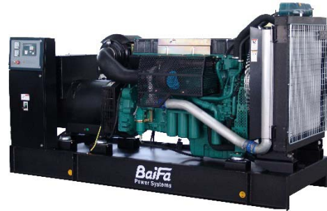
机组外形，仅供参考