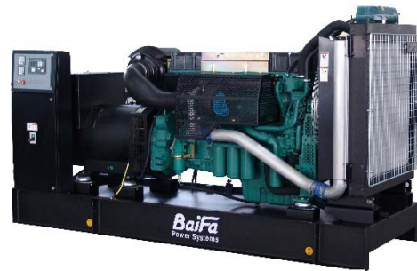
机组外形, 仅供参考