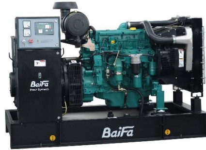
机组外形，仅供参考