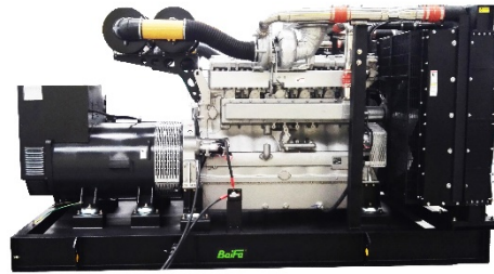
机组外形，仅供参考