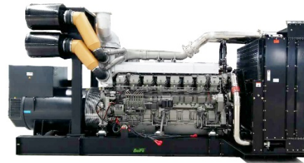
机组外形，仅供参考