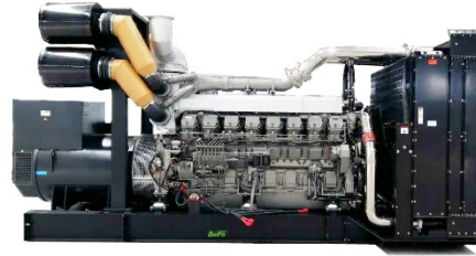
机组外形，仅供参考