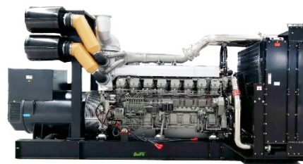
机组外形，仅供参考