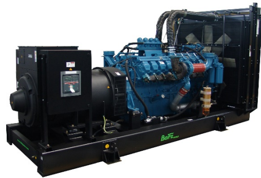
机组外形，仅供参考