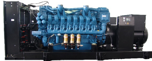
机组外形，仅供参考