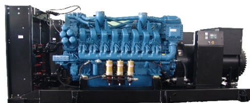
机组外形，仅供参考