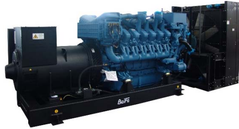
机组外形，仅供参考