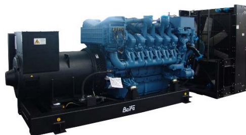
机组外形，仅供参考