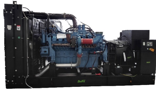
机组外形，仅供参考