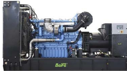
机组外形，仅供参考